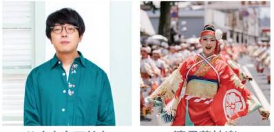
ハナカタマサキ 濱長花神楽