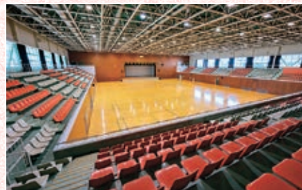
高知県立県民体育館