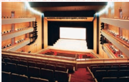
高知市文化プラザかるぼーと