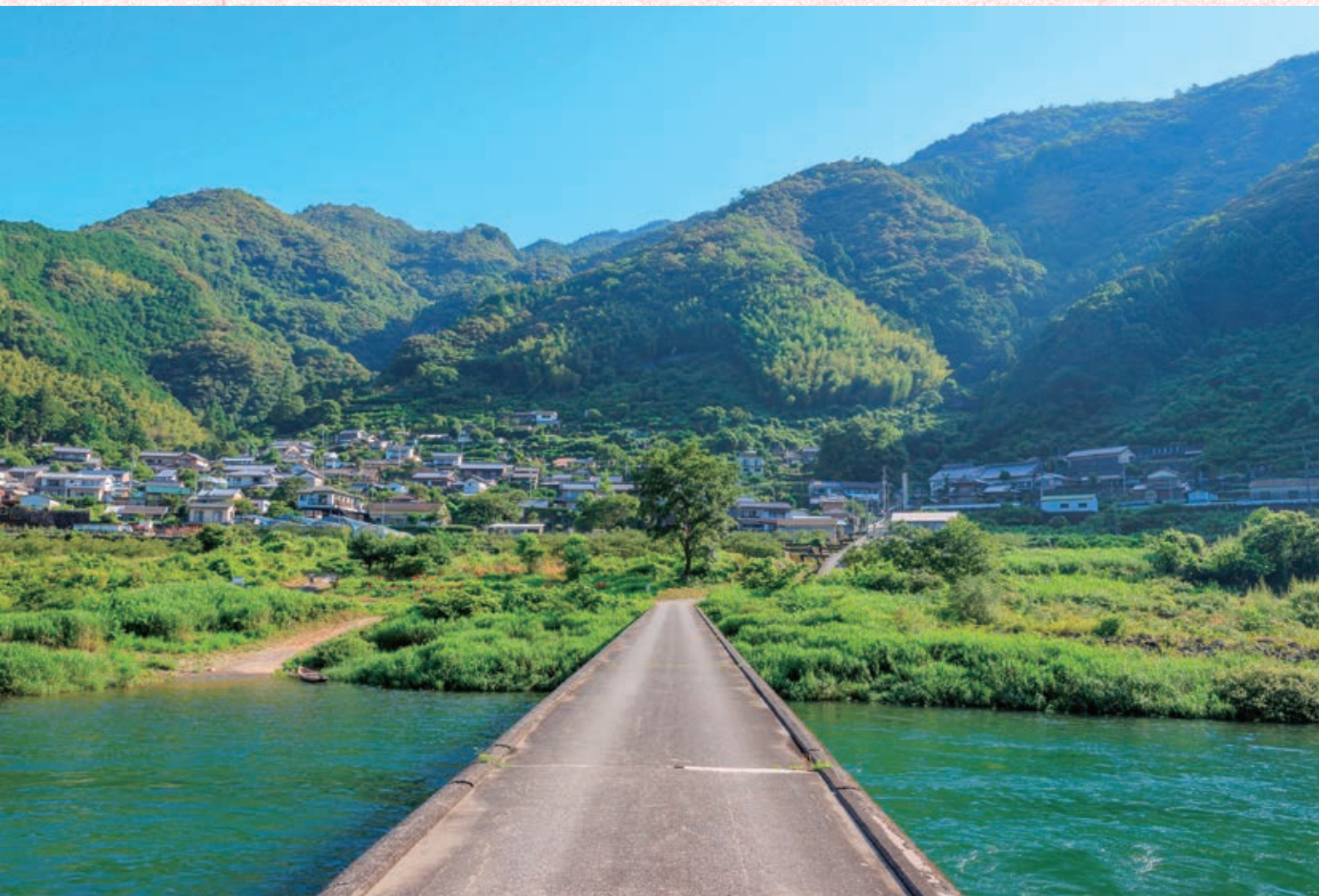
越知町「浅尾沈下橋」