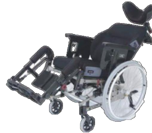
電動車いすリクライニング式