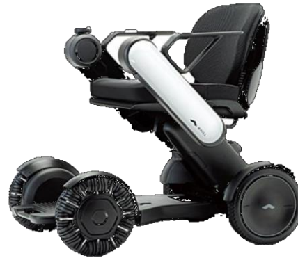
電動車いす最新折りたたみ式