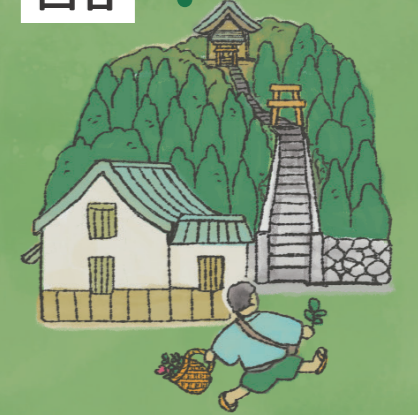
牧野富太郎ふるさと館 (牧野博士生家跡)