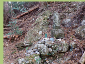
▲不動明王地蔵が祀られた場所に露出するチャートの岩盤。

ガラス質の殻をもつ放散虫と呼ばれるプランクトンの遺骸が海底に堆積して固まった岩石。遠洋の深海底で作られる。四国山地で多く見られ、硬くて風化しにくい。ため、ゴツゴツした急峻な山となる。保水性に劣るため乾燥した地帯を作る。室原～鳥の巣ルートのお不動さん近くで多く見られる。