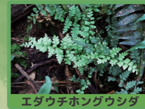
エダウチホングウシダ