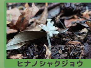
ヒナノシャクジョウ