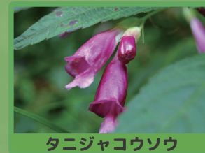
タニジャコウソウ